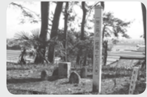
▲園家山頂上の石標