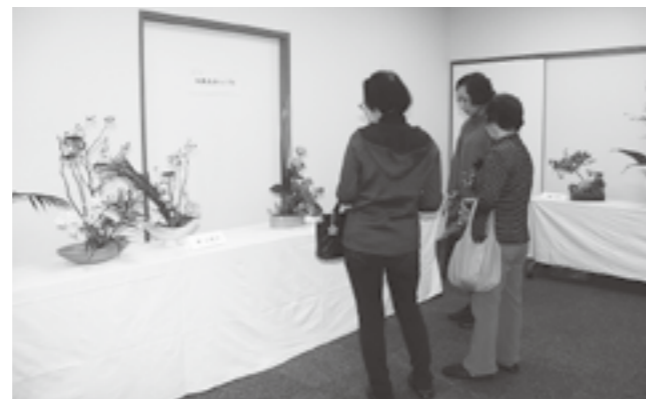
▲草月流いけばな展