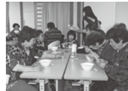
▲ふれあい食堂・豚汁