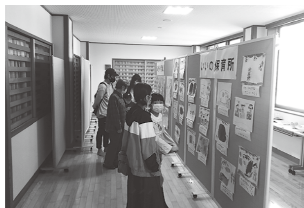
いいの保育所・飯野小学校 (作品展示コーナー)