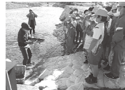
11/7 鮭の遡上学習体験