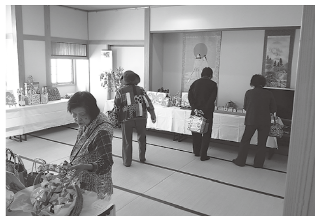
小物作品展示コーナー