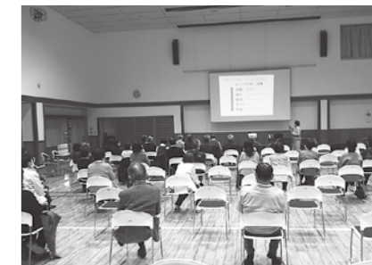
11/17 社会福祉協議会講演