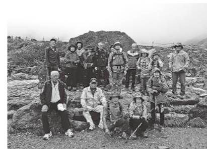
10/5 歴史探訪 室堂散策