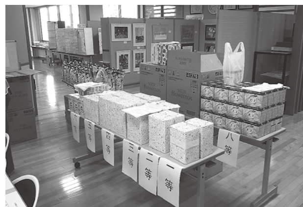
スピードクジ 1～10等の景品 (はずれなし)

なかなか終息の見えない新型コロナウイルス、入善町において公民館まつりを自粛する地域もある中、今年度も昨年と同様に、作品展示とスピードクジ大会を行いました。日々クラブ活動で頑張っておられる人たちの発表機会を提供してあげられない公民館として、申し訳なく思っています。令和5年度は、演芸発表や豚汁、ソバなどの飲食ができる公民館まつりが開催できるような年になって欲しいと願っています。