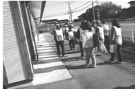
建屋屋外安全点検

まず最初に、建屋屋外の壁の剥がれや屋根の状態などの点検を行います。建屋の外観の安全が確認されたら、次に建屋内部の安全点検を行います。建屋内外の安全点検の結果を入善町役場に連絡し、避難所の開設準備に入ります。