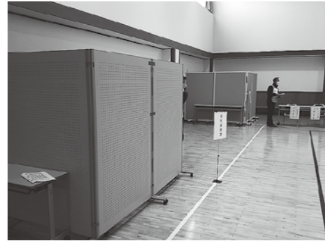
作り終えた男女更衣室

令和4年12月10日(土)午前9時～11時10分にかけて、飯野公民館避難所開設準備訓練が行われました。富山県危機管理局、入善町役場、飯野地域町議会議員を来賓に迎え、防災士や防災協議会役員、防災推進委員等20名が訓練に参加しました。