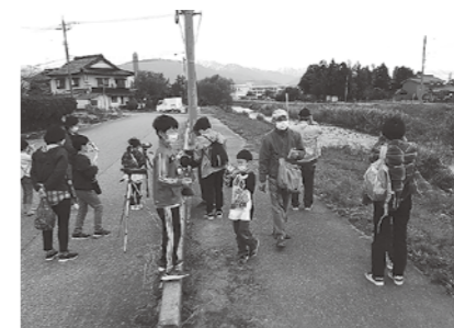
11/13 バードウォッチング