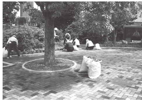
7月13日に行われた除草と剪定