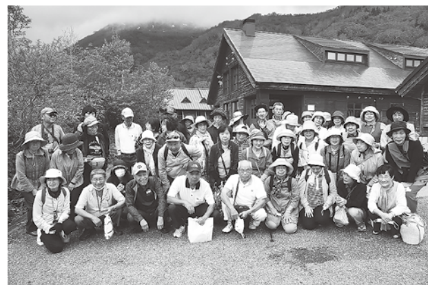
柵池自然公園での集合写真