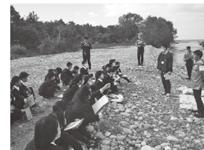
11月8日 鮭の採卵見学

飯野小学校5年生と先生、公民館職員で、黒部川に設置された築場見学と内水面漁業協同組合で鮭の採卵見学を行いました。