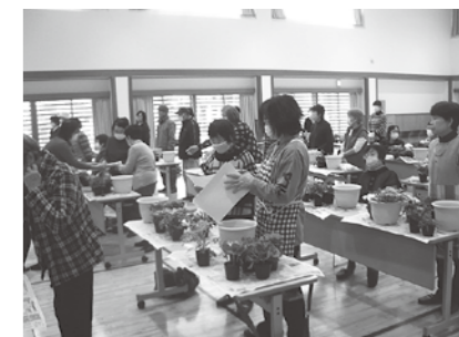
12月7日 寄せ植え教室

昨年度までは、球根の定植や公民館回りの草むしりをしていただいている園芸ボランティアの方を対象として開催していましたが、今年度は対象枠を広げため、48名の参加で行いました。