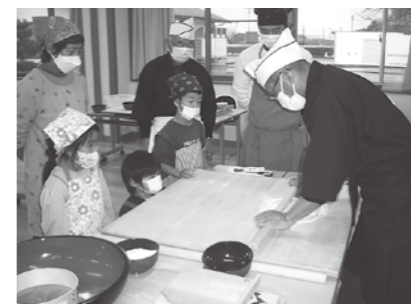
12月3日 親子そば教室

そば友の会に協力していただき、小学生とその保護者で親子そば教室を行いました。そうめんのようなそばからさしめんのようなそばができて、みんなで試食しました。